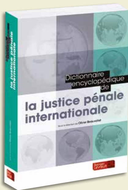
Dictionnaire de la justice pénale internationale , sous la direction d'Olivier Beauvallet, Berger-levrault, 1200 pages, 75 €.